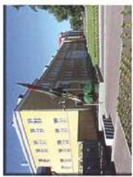
Ярославское ВВЗРУ ЛВО (ВН)