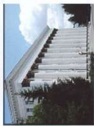
Челябинское ВВАУШ (ВН)