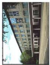
Сызранское ВВАУЛ (ВН)

Академия является достойным правопреемником Института Инженеров Красного Воздушного Флота имени Н.Е. Жуковского, образованного 26 сентября 1920 года и в 2020 году отмечает 100-летний юбилей со дня своего создания.