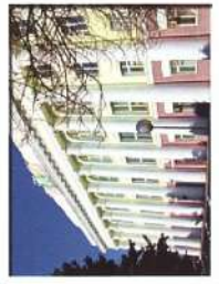
Краснодарское ВВАУЛ (ВВ)