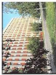
ВВЗРУ (г. Воронеж)