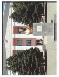
Ейское ВВАУЛ (ВВ)