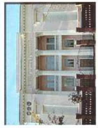
ВВИА им. профессора Н.Е. Жуковского

Краснодарское военное авиационное училище летчиков (военный институт) им. Героя Советского Союза А.К. Серова в 2012 г. филиал ВУНЦ ВВС «ВВА» (г. Воронеж), в 2015 г. восстановлено в статусе самостоятельного военного учебного заведения;