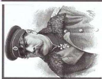
Э.Н. Толстой, инженер-генерал, герой Крымской войны. 1853-1856 г.г. (1818-1884)

В последующие годы военное ведомство России уделяло большое внимание развитию военного воздухоплавания. В 1904 г. под руководством члена-корреспондента Императорской Академии наук Н.Е. Жуковского на личные средства промышленника, мецената и одного из основоположников экспериментальной авиации Д.П. Рябушинского был основан первый в Европе Аэродинамический институт. 1909 г. стал годом создания русской авиационной промышленности - на заводе «Первое Всероссийское товарищество воздухоплавания» был выпущен первый российский самолет - биплан «Россия-А».