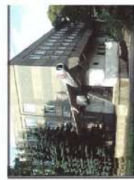
Ставропольское ВВАИУ РЭ (ВН)