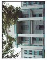
ВВА им. Ю.А. Гагарина