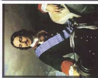
Петр I, Император Всероссийский (1672-1725)

Первое боевое крещение российские воздухоплаватели получили в годы Русско-японской войны (1904-1905). Сформированная по решению императора Николая II Сибирская воздухоплавательная рота (с 1905 г. - батальон), в составе 2-й и 3-й Маньчжурских армий, сыграла заметную роль на Дальневосточном театре войны.