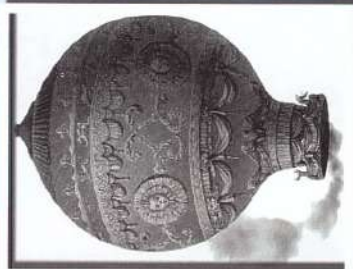
Шар братьев Монгольфье (Франция, 1783 г.)