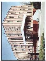
ВАИУ (г. Воронеж)