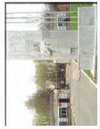
Санкт-Петербургское ВВАУЛ (ВВ)