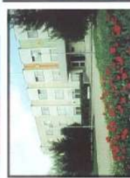
Иркутское ВВАИУ (ВН)