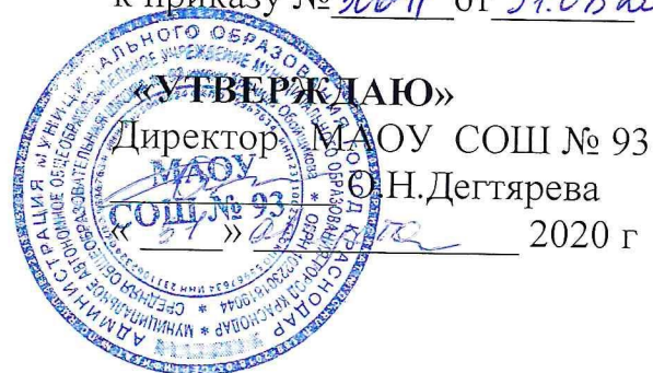
График проветривания и влажной уборки в кабинетах МАОУ СОШ № 93

Приложение № 15 к приказу № 306-17 от 31.08.2020